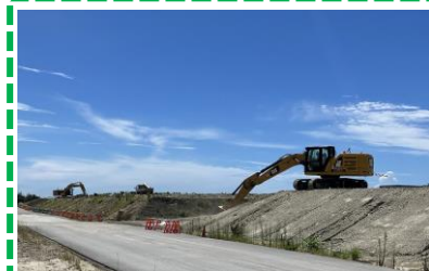
開放エリア 盛替え作業 建設工事で発生した土を開放エリアの建設に有効活用するため、土の盛替え作業を行っています。