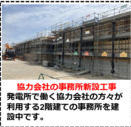
協会の事務所新設工事 発電所で働く協会の方々が利用する2階建ての事務所を建設中です。

1号機営業運転開始から約1ヶ月経過！ 6月30日より営業運転を開始してから1ヶ月程が経過し、現在も安定して運転を継続しております。今夏における電力需給ひっ迫の回避に向け、これからも貢献していきます。