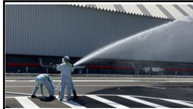
放水訓練を実施しました！ 万が一の火災に備え、消防隊メンバーによる放水訓練を実施しました。非常時の備えも整えています。

来月の予定 <2号機> 運転開始後、太陽光や風力などの再生エネ由来の電力に合わせ電力の需給バランスを調整するため、負荷変化試験を実施し、発電設備が所定の出力を安定して出すことができるか確認します。 <緑化・開放エリア> 皆様に心から楽しんで頂けるよう、横須賀市と協議を重ね、開放エリアの設計を進めていきます。また、並行して設計内容を詳細に決める為、引き続き測量作業・現地調査を行っています。