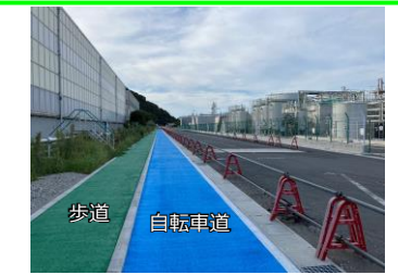
ふれあい通り歩道・自転車道完成 発電所入口～開放エリアを結ぶ道路に歩道と自転車道の色分けをしました。地域のみなさまが利用される通路となります。

来月の予定 ＜2号機＞ 燃料となる石炭を異なる産地のものにて試運転を行い、12月下旬の工事完了に向けて最終調整を行っていきます。 ＜開放エリア＞ 大海原、大自然をバックグラウンドとした美しいランドスケープにするべく、開放エリアに植樹する樹木の設計を進めています。樹木を生産している農園を視察し、より魅力的な空間づくりに努めていきます。