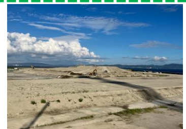
開放エリア 造成中 丘のように高く広がった山ができてきました。こちらの盛土状況を踏まえ、横須賀市役所のみなさまにも現地を視察していただいております。